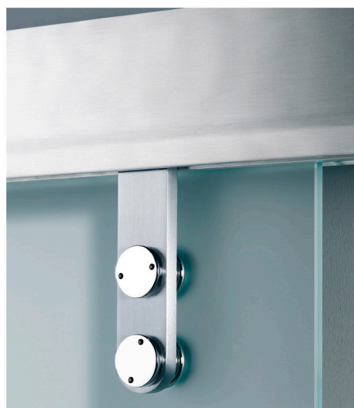
■ Art. V-2004 Morsetti versione tecnica per guida scorrimento Sesamo. Clamp carriers Tech for Sesamo sliding track. Klemm-Laufwagen Technik für Sesamo Laufschienenprofil.