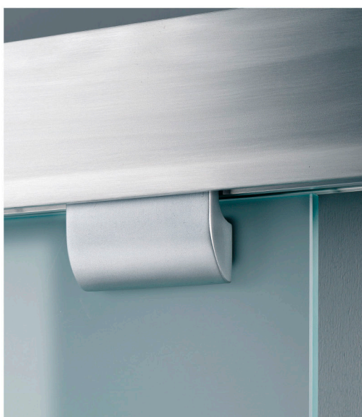
■ Art. V-2003 Morsetti versione Griff per guida scorrimento Sesamo. Clamp carriers Griff for Sesamo sliding track. Klemm-Laufwagen "Griff" für Sesamo Laufschienenprofil.